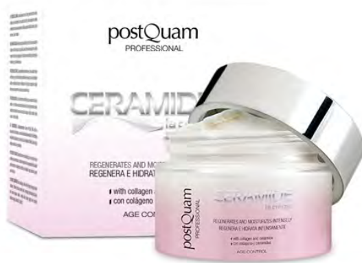
Crema 50 ml