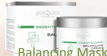
Balancing Mask 200 ml