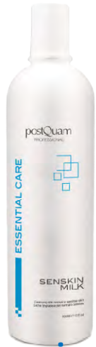
Cleansing Milk 500ml