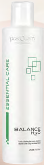
Facial Toner 500ml