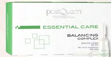
Ampulas Control de La Grasa y Acne