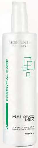
Cleansing Milk 500 ml